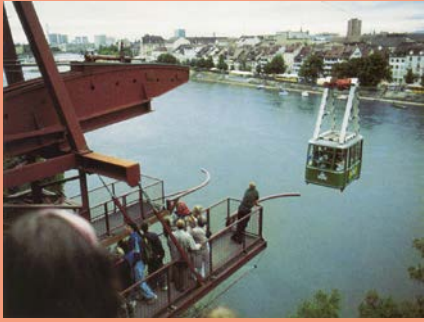
Gondelbahn bei der Münsterpfalz, 1992