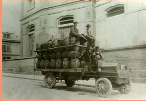
«Motor-Lastwagen Söller» vor der Brauerei Wardeck am Burgweg, undatiert (um 1910)