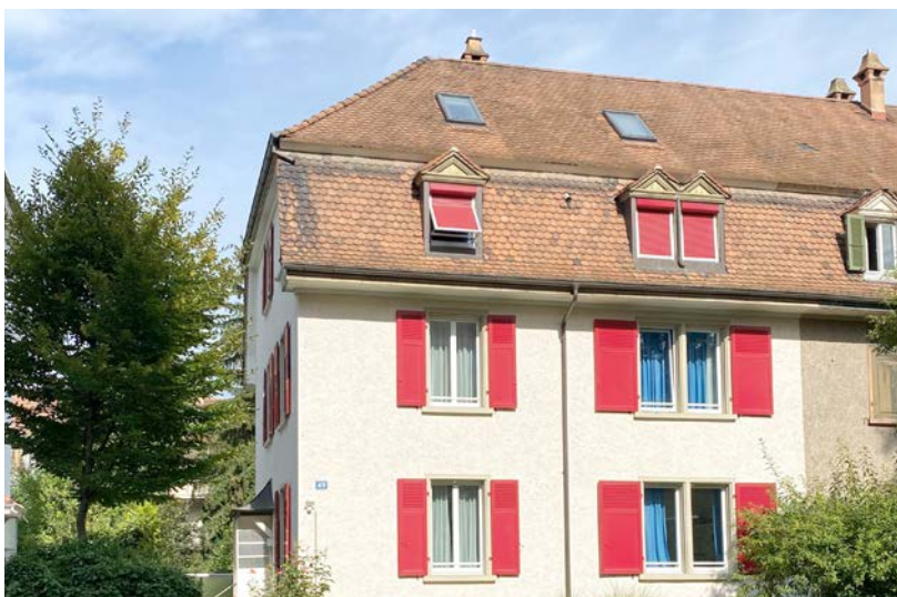
Die Aussenwohngruppe Schoren befindet sich am Schorenweg 49.