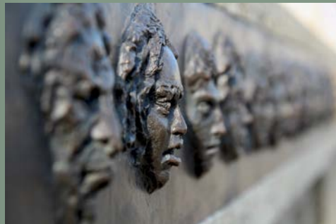
Gedenktafel für die Opfer der Hexenverfolgung an der Mittleren Brücke, 2019