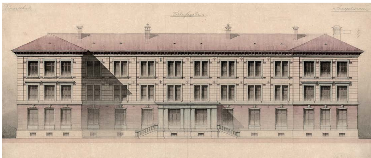
Fassadenzeichnung der Sevogelschule, Vischer & Fueter Architekten, 1883