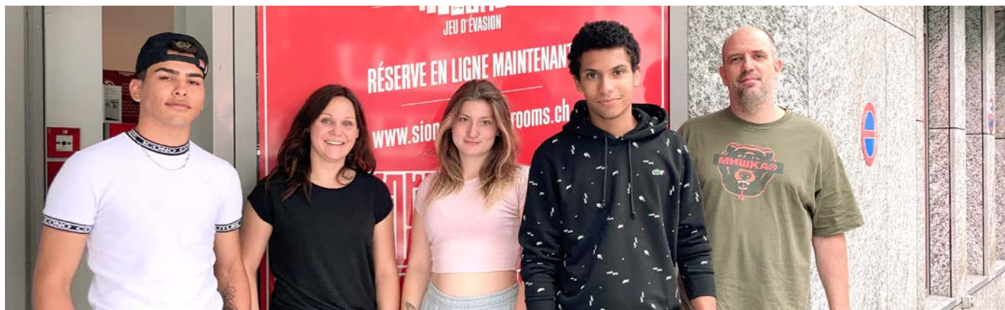
Ausflug im Sommerlager im Wallis – gemeinsame Aktivitäten stärken den Gruppenzusammenhalt.

Zusammenlebens in der Gruppe dar, denn das gibt Halt und Orientierung. «Auch wenn es nur das Zimmer ist, das man am Wochenende in Ordnung bringt, es gibt einen Rhythmus», erzählt Tamara und schliesst an: «Am tollsten ist, wenn die Gruppe leer ist und die Sozis wirklich Zeit für einen haben.»