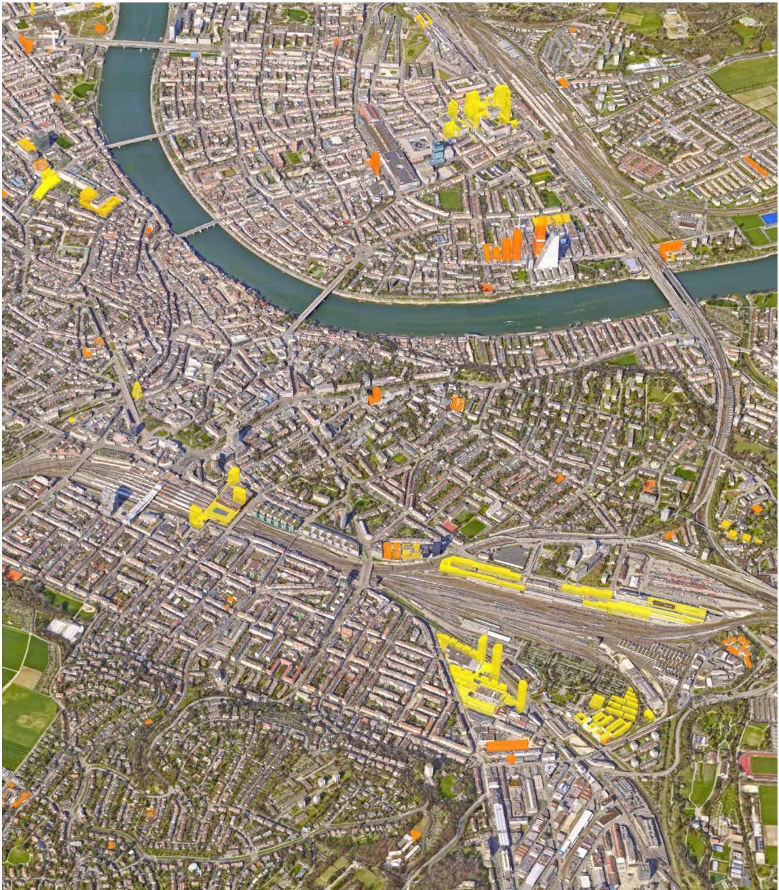
Basel von oben, 3-D-Luftbild mit Bauprojekten, 2020, Details zur aktuellen Ausstellung im Stadthaus Seite 14, Quelle: Grundbuch- und Vermessungsamt BS