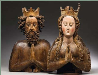
Reliquienbüsten Kaiser Heinrichs II. und seiner Frau Kunigunde, Anfang 15. Jh.