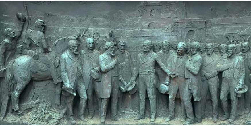
Eines der bronzenen Reliefs am Strassburger Denkmal