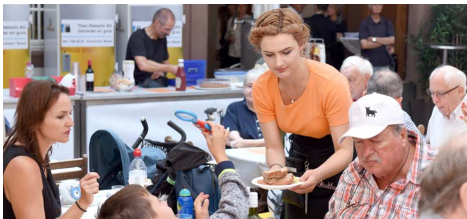
Der BG-Zustupf an die Semestergebühren stiess auf eine riesige Nachfrage.