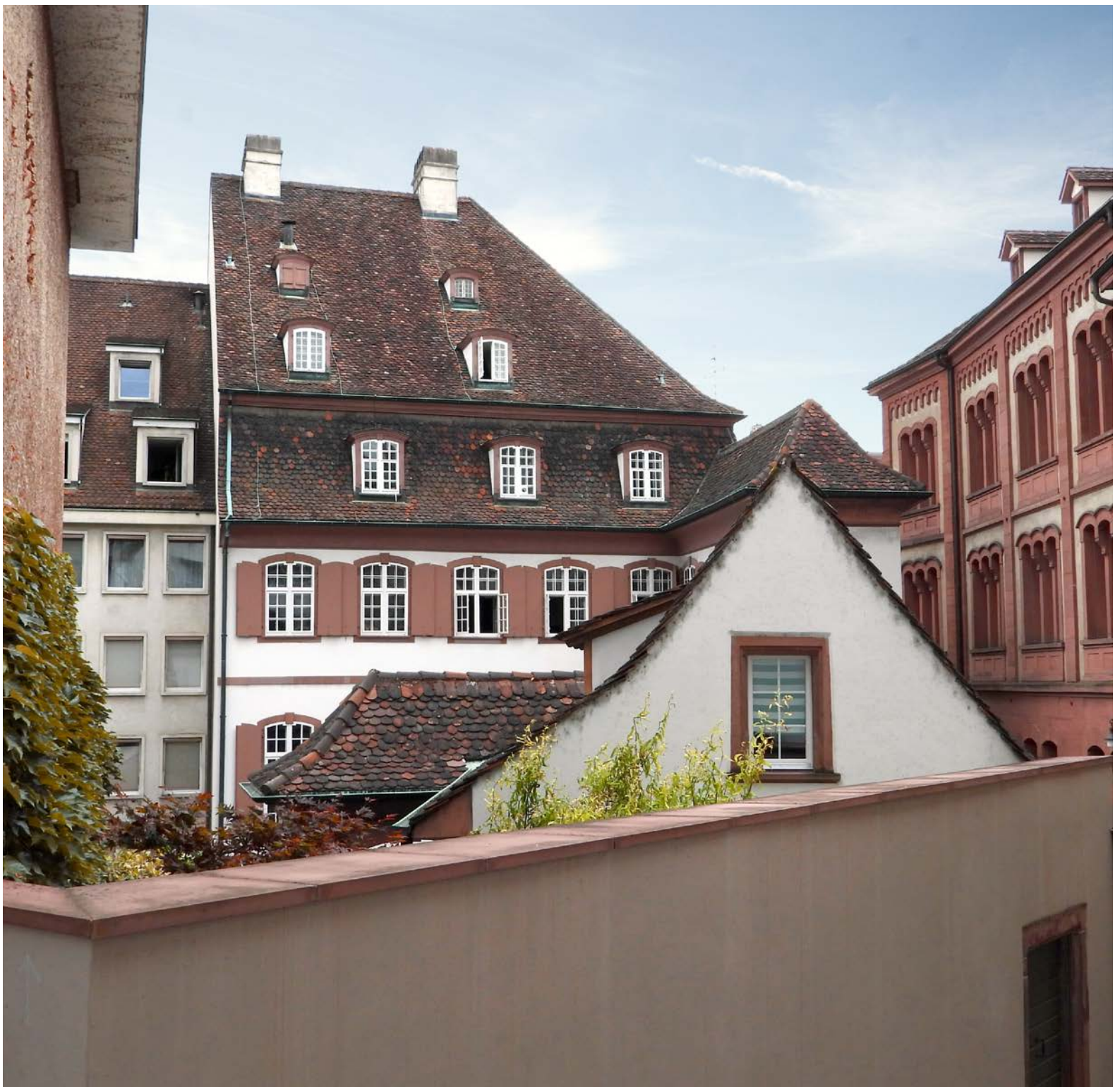
Rückseite Haben Sie es erkannt, das Basler Stadthaus von hinten, aufgenommen im Totengässli?