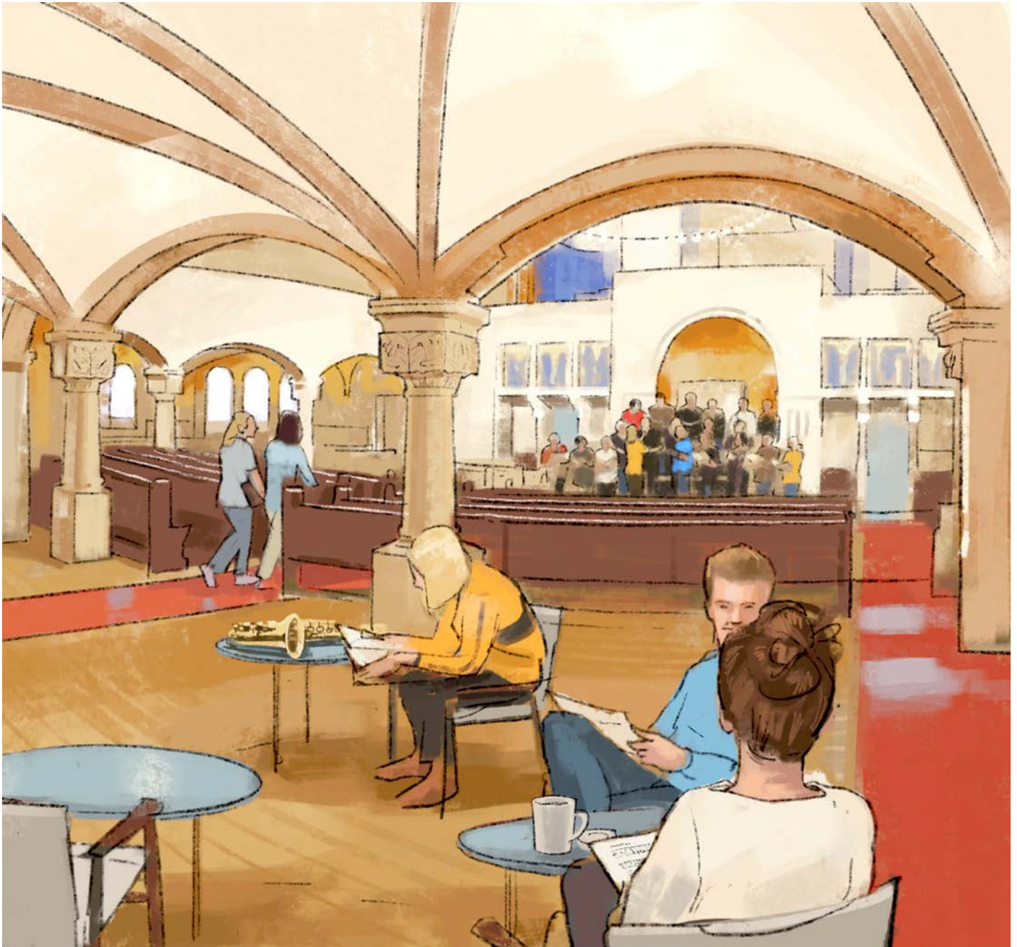
Illustration: Courvoisier, Javier Alberich