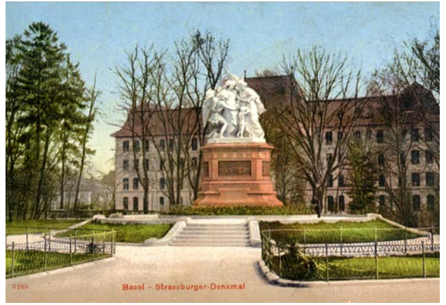
Das Strassburger Denkmal auf einer historischen Ansichtskarte