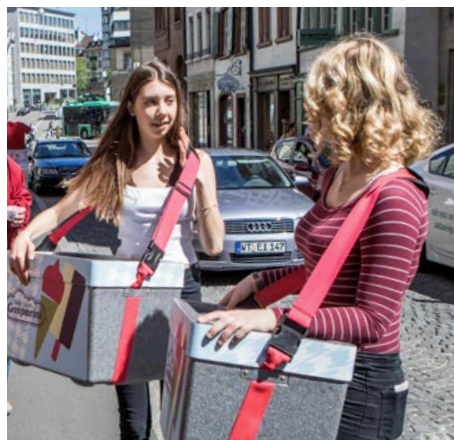
Studentenjobs fielen Corona zum Opfer.

369 der insgesamt 413 Gesuchstellenden erfüllten die Kriterien und konnten sich über die Soforthilfe freuen. Die Aktion dauerte von Ende Mai bis Ende Juni 2020. Vergeben wurden CHF 221 400; aufgrund der grossen Nachfrage wurde das ursprüngliche Kontingent von rund CHF 100 000 schon kurz nach dem Start mehr als verdoppelt. agi