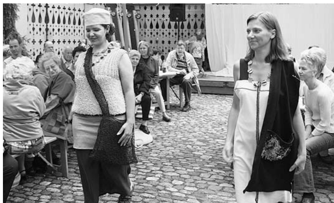
Anziehende Mode, vorgeführt von den Schöpferinnen selbst.